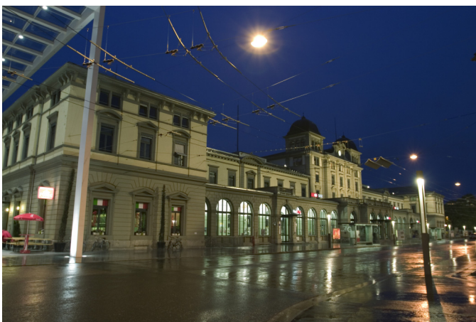
Bahnhofplatz Winterthur