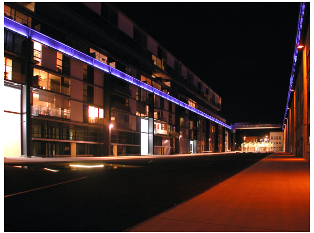
Katharina Sulzer-Platz, Sulzerareal Winterthur Stadt