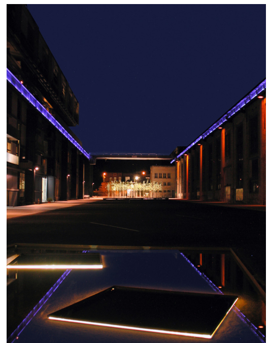
Katharina Sulzer-Platz, Sulzerareal Winterthur Stadt